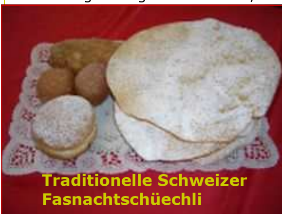
Traditionelle Schweizer Fasnachtschüechli