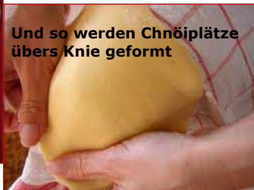
Und so werden Chnöiplätze übers Knie geformt

liche Vieh zu Essbarem verarbeitet, den fetten, schmutzigen Donnerstag .