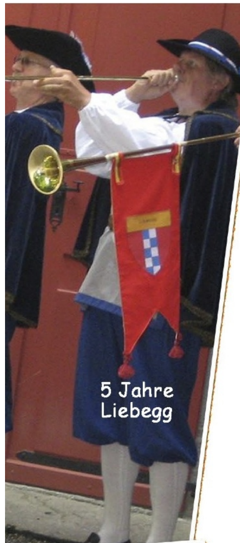
5 Jahre Liebegg